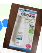
冬のオススメアイテム

コロナ禍でマスクをしているとメガネが曇ることがよくありますよね(;v;) 薬局などで販売している、こちらの商品をシュッシュとスプレーするだけで、曇りがなくなるのでオススメです!