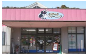
こちらは福井市羽坂にある本店